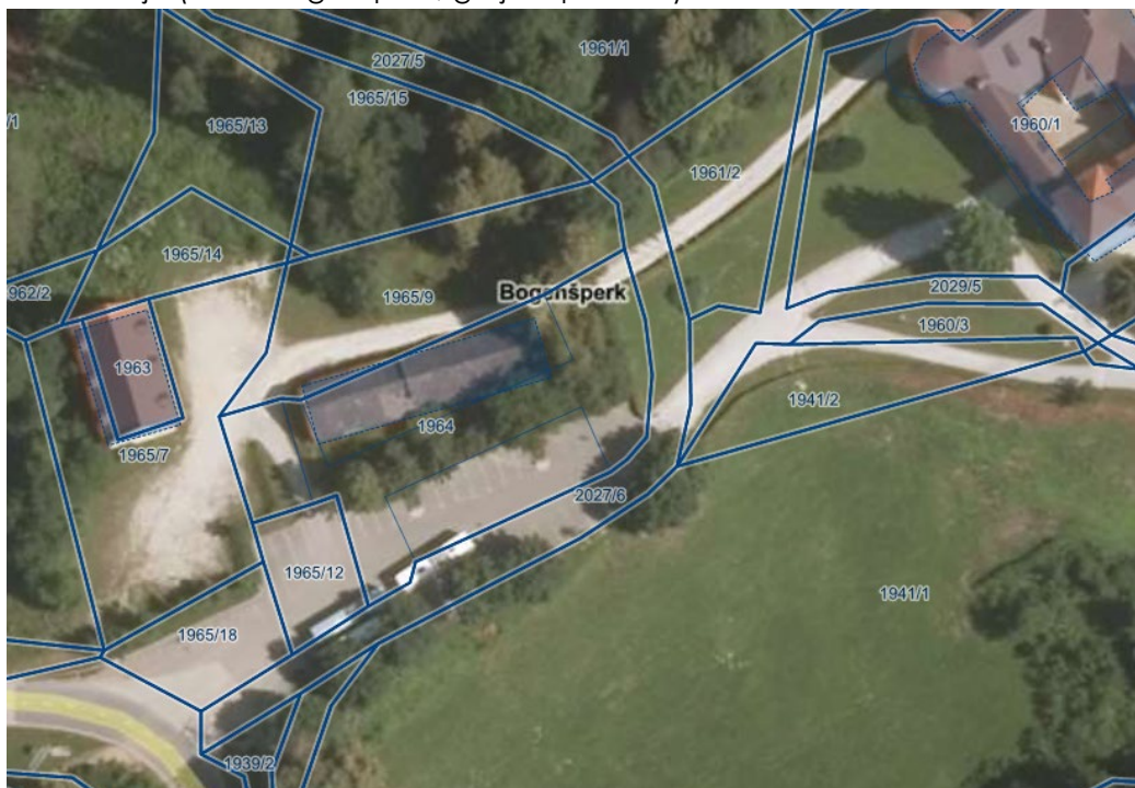
Slika 6: Mikro lokacija (Grad Bogenšperk, grajska pristava)