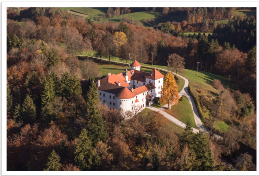
Slika 2: Grad Bogenšperk