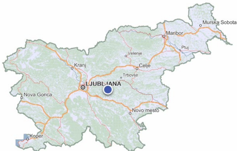
Slika 5: Makro lokacija (Grad Bogenšperk, Slovenija)

Spletni vir: <zemljevid.najdi.si> (Zadnji dostop 6. 3. 2020).