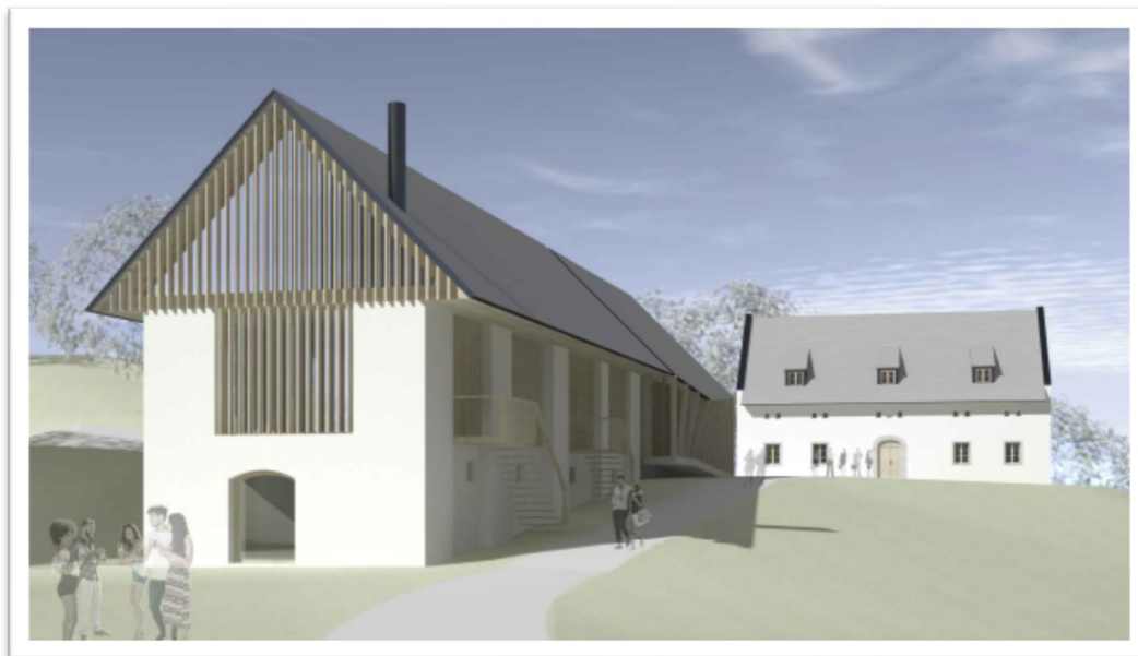
Slika 1: Razpršeni hotel Bogenšperk