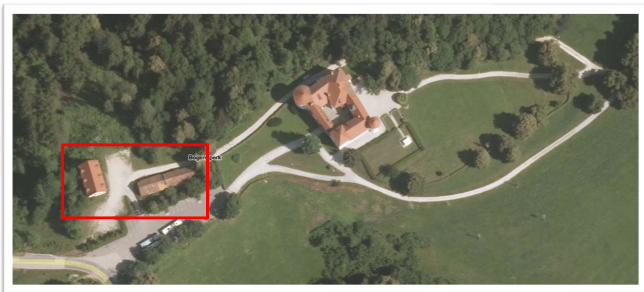
Slika 3: Območje grajske pristave (levo) v neposredni bližini gradu